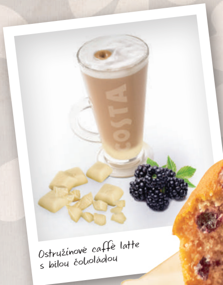
Ostružinové caffè latte s bílou čokoládou

NADÝCHANÝ MALINOVO-BORŮVKOVÝ MUFFIN JE PLNÝ OVOCE, TAKŽE SI HO MŮŽETE DOPRÁT, I KDYŽ UŽ PLÁNUJETE JARNÍ REVIZI ŠATNÍKU.