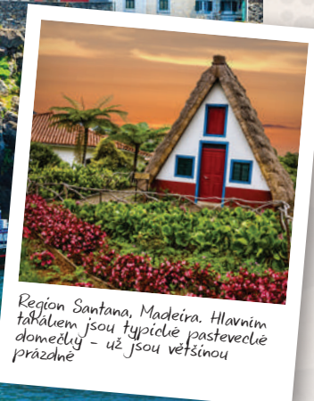
Region Santana, Madeira. Hlavním tahákem jsou typické pastevce prázdné