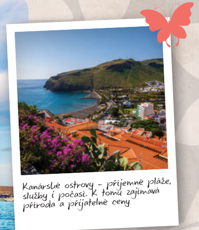
Kanárské ostrovy - příjemné pláže, služby i počasí. K tomu zajímavá příroda a přijatelné ceny