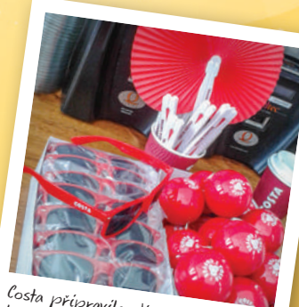
Costa připravila divákům dárky do každého počasí.

Návštěvníci si kromě koncertů užili bohatý doprovodný program, k němuž patřila i lahodná káva a další nápoje z outdoorové kavárny Costa Coffee a z pěti kávovarů Costa Express stojících na různých místech festivalu. Před útulnou zastřešenou kavárnou na Kampě, kde se o hosty starali vyškolení baristé, nechyběla ani zahrádka, která pro návštěvníky festivalu představovala prostor pro příjemný odpočinek mezi jednotlivými vystoupeními, ale i posezení během koncertů, jelikož byla umístěna přímo vedle hlavní stage, a tak si mohli vychutnat hudbu i kávu současně. Costa Coffee také divákům rozdávala originální Costa dárky v podobě slunečních brýlí, vějířů, pláštěnek a triček.