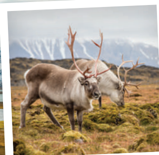
Na Špicberkách potkáte nejen lední medvědy, ale i soby, kteří se tu pasou i ve městě mezi domy.