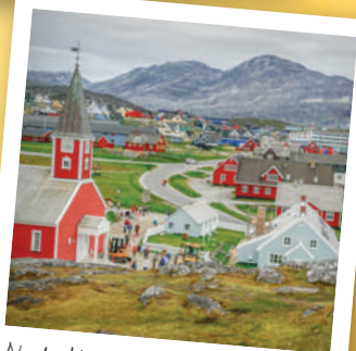
Nuuk, hlavní město Grónska - právě v této grónské "metropoli" s téměř 17 tisíci obyvateli najdete vánoční poštovní úřad, kam chodí dopisy Santa Clausovi z celého světa.