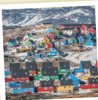
Ilulissat, severní Grónsko - třetí největší město ostrova, v němž žije kolem 5 tisíc lidí. Původní esbymaciá vesnice je častým cílem turistů, místní ledovecový fjord patří na seznam UNESCO.