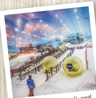
Ski Dubai. Zvenku vypadá areál jako přistávací UFO. A představa lyžovačky uprostřed pouště tady i působí.

I přes válku zuřící v sousední Sýrii je Libanon stále považován za relativně bezpečnou turistickou destinaci. Ovšem bezpečnostní situace v zemi je poměrně křehká, vyplatí se proto už při případném plánování cesty kontaktovat českou ambasádu v Bejrútu a přeptat se na podmínky. A pozor – v cestovním pasu byste při vstupu do Libanonu neměli mít izraelské vízum či razítko z jordánských nebo egyptských hraničních přechodů s Izraelem.