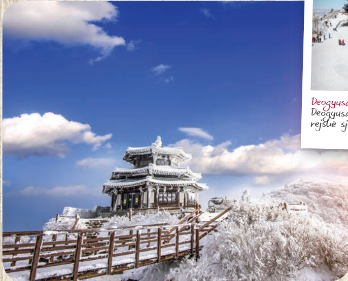
Deogyusan, Jižní Korea. Pohoří Deogyusan je domovem nejdelší ložejší sjezdovky Sillu Road Slope.

Jen hodinu od jihokorejské metropole leží Vivaldi Park, který je po-