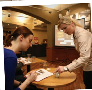
Malý počet účastníků umožňuje lektorům individuální přístup