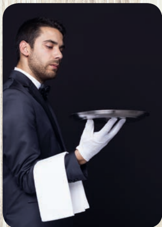
Etiketa v praxi