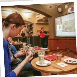
Na účastnily semináře celá nejen teorie, ale i praxe.

Proškolení experti provedou každého účastníka během pěti hodin procesem, kterým musí projít kávové zrno, než se dostane do šálku lahodné kávy. Poutavým způsobem projdou cestu kávy od rostliny kávovníku, sklizně a zpracování surového zrna až po pražení a následnou práci baristů v kavárně. Účastníci semináře si také mohou prakticky vyzkoušet přípravu espressa na profesionálním stroji, napěnění mléka i náročnou techniku latte art, kterou baristé kouzlí obrázky na povrchu kávy. Na závěr obdrží absolventi