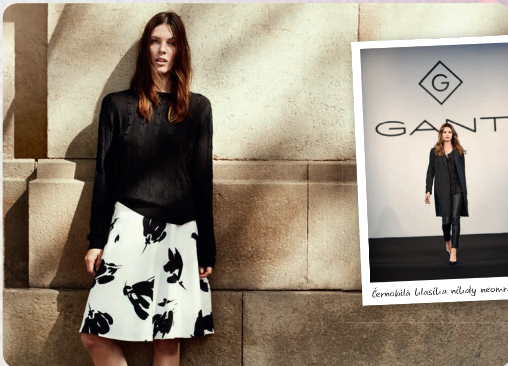
Černobílá lila síla nikdy neomrzí.

Vyšperkujte si skříň jedním z diamantů z kolekce GANT Diamond G jaro/léto 2016.