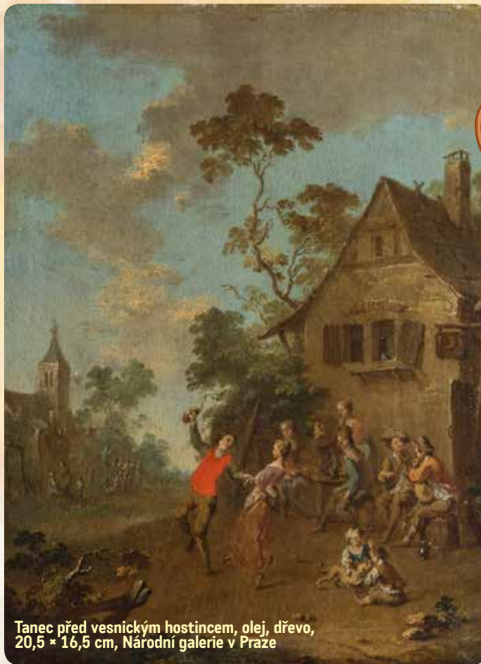
Tanec před vesnickým hostincem, olej, dřevo, 20,5 * 16,5 cm, Národní galerie v Praze

Marika Gombitová se po dlouhé odmlce vrátila na koncertní pódium v loňském roce u příležitosti svého životního jubilea a čekalo ji upřímné a bouřlivé přivítání. Rozhodla se proto, že své české a slovenské fanoušky potěší znovu, a to jediným koncertem letošního roku, pro který si vybrala Prahu. Sen Mariky Gombitové, naprosto jedinečný koncert s řadou hostů, můžete navštívit 2. prosince v pražské Tipsport Aréně.