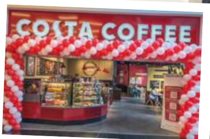
Další Costa Coffee kavárna byla slavnostně otevřena v Ústí nad Labem v OC Forum.

TIP! ZPŘÍJEMNĚTE SI VÁNOČNÍ NÁKUPY V NĚKTERÉ Z NOVĚ OTEVŘENÝCH KAVÁREN.