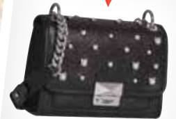
Hravé detaily oživují i stylové kabelky