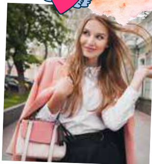
Dva kousky růžové zcela promění jinak fádni černo-bílý outfit.