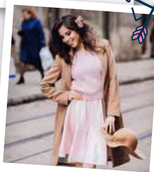
Dobře se doplňuje i s velbloudí hnědou.