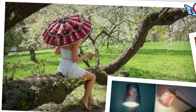
Costaslunečník vynesl Petře Šebestové rok kávy zdarma.

Děkujeme všem, kteří se nechali inspirovat naší kávou ke krásným výtvorům. Sledujte náš facebookový profil www.facebook.com/CostaCoffeeCZ , kde se již brzy dočkáte dalších soutěží o zajímavé ceny.