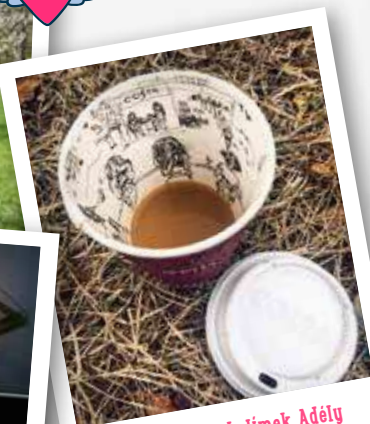
Ilustrovaný Costakelímek Adély Bártové odměňujeme dárkovým balíčkem.