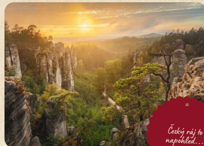
Český ráj to napohled...

9 Sněžka Všichni si pamatujeme ze školy, že Sněžka je se svými 1 603 metry nad mořem naší nejvyšší horou, ovšem kdo z nás už zdolal její vrchol? Vydejte se na něj pěšky po jedné z oblíbených turistických tras anebo se nechte vyvézt lanovkou. Pokochejte se pohledy na hřebeny Krkonoš, nahlédnout můžete i do Polska, jelikož tudy prochází česko-polská hranice.