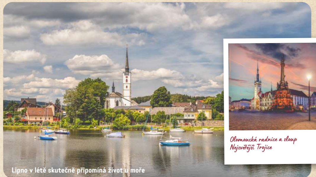
Lipno v létě skutečně připomíná život u moře

5 Brno Druhé největší město se stejně jako Praha může pochlubit mnoha výjimečnými památkami a jedinečnou architekturou, ale také pulzujícím (nejen studentským) životem. Brno má svého ducha, kterého stojí za to objevit. Za všechny zdejší památkové skvosty jmenujme dva – vilu Tugendhat, střešní dílo světové funkcionalistické architektury, a hrad a pevnost Špilberk.