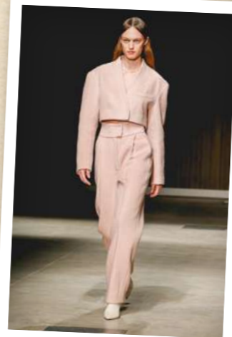
Krátké sako do pasu prodlužuje nohy a celou postavu.

I když nejste žádná celebrita, můžete si služby stylisty dovolit. Není pravda, že jsou jen pro vyvolené. Tři hodiny času věnované pouze vám většinou vyjdou od 2 500 do 3 000 Kč. Dávejte si ale pozor, ať neuletíte.