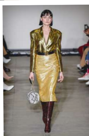
Letošnímu podzimu vládnu metalické, skořicové a žluté barvy.

U módních volání se vyplácí střídmost. Postavě mohou přidat několik kilogramů.