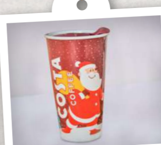
Vánoční keramický hrnek

Někdo to rád pohodlné! Tyhle kapsle do kávovarů Nespresso jsou směsí arabiky a robusty. Obsahují pomalu praženou kávu s jemnou oříškovou chutí a bohatým aroma. Však jsme také až po 112 pokusech přišli na tu pravou vyváženou směs. Nyní ji nabízíme v kapsli. Voňavý šálek je připravený v mžiku. Balení obsahuje 10 kusů.