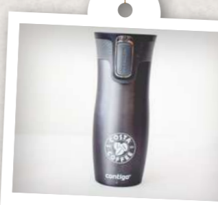
Termoska Contigo Gunmetal

Někdo to rád horké! Tenhle kříženec mezi termoskou a hrnkem má krásný unisex design a objem 400 ml. Hodí se prostě pro každou příležitost, takže už není důvod brát si kávu do jednorázového kelímku. Káva v takovém objemu navíc hned tak nevychladne.