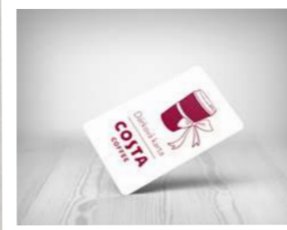
Dárková karta Costa Coffee

Někdo to rád mužně našlapané! Tato kovová termoska je na celých 475 ml kávy. Nemusíte se tedy bát, že v ní káva vychladne ani že rychle dojde. Hodí se skvěle k pánskému obleku i ležérnímu stylu ostříleného dřevorubce. Je to kofeinový zásobník na jakoukoliv přestřelku se životem.