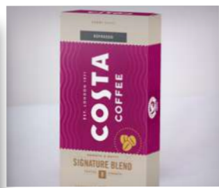
Kapsle Signature Blend Espresso

Někdo to rád výběrové! Dobrou kávu neurazíte nikoho. Nemusíte se bát, že vyberete špatně – naši baristé se postarali za vás. Máme pro vás hned dva druhy: klasickou jemnou kávu na každý den Signature Blend a tělnatou 100% arabiku s medovými tóny Bright Blend. První je osvědčená směs arabiky a robusty, kterou nabízíme už půl století, druhá je z pečlivě vybíraných zrn z regionů Jižní Ameriky, skvělá pro černé espresso.