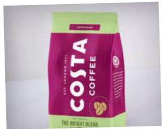
Balená káva 500 g

Někdo to rád s přesahem! Ochucenou kávu je možné si snadno připravit i doma. K tomu jsou ideální sirupy Monin v mini balení. Nabízíme sadu pěti sirupů s nejoblíbenějšími příchutěmi. Karamelové, vanilkové, perníkové, lískooříškové nebo amareto kávy propadnou všichni požítkáři. Káva už nikdy nebude chutnat stejně jako dřív.