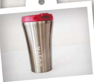
Kovový termohrnek EVO

Někdo to rád stylové! V kovové termosce moderní melounové barvy káva jen tak nevychladne. Má objem 295 ml, což z ní dělá ideálního partáka pro ranní rituál při procházení e-mailů. Krásně padne do dámské ručky a skvěle se vyjímá na každém kancelářském stole.