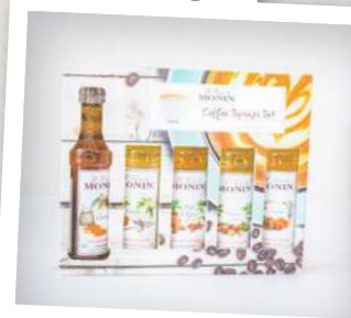
Kávové sirupy Monin

Pokud zase letos dumáte, co koupit k Vánocům, usnadníme vám práci. Dejte si u nás svou oblíbenou kávu a nechte se inspirovat. V Costa Coffee můžete pořídit dárek pro babičku, tetu, kamarádku i bratra. Pro znalce kávy, pro hipstery, pro ty, kterým byste normálně dávali peníze, i pro všechny, kdo mají místo věcných dávků raději zážitky.