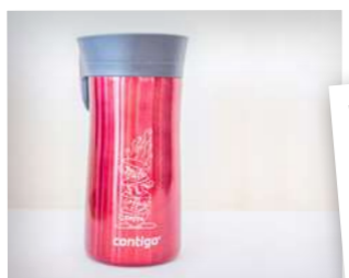
Termoska Contigo Watermelon

Někdo to rád keramické! Vztít si kávu s sebou, to je takový americký rituál. V termohrnku nebo kelímku už i u nás nosí kávu kdekdo a tyto přenosné kávové nádoby se vlastně staly módním doplňkem. Pro všechny, kdo nechtějí jít s davem, je náš vánoční keramický hrnek s víčkem tím pravým. Má krásný vánoční design a velikost tak akorát.