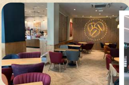
Václavské náměstí, pasáž Fénix