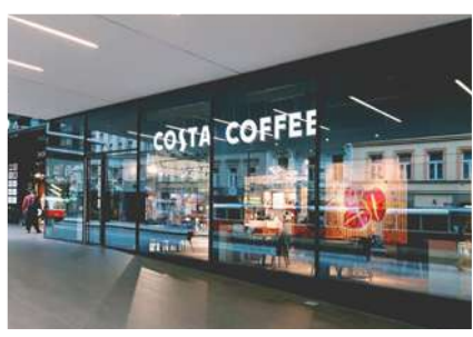
Nákupní centrum Quadrio

Na podzim se v Praze chystá otevření dalších tří kaváren. Brzy už budete moci zajít na kávu na Strossmayerovo náměstí, do obchodního domu Bílá labuť Na Poříčí a do holešovické ulice Komunardů.