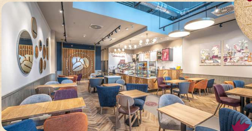
Obchodní centrum Spektrum