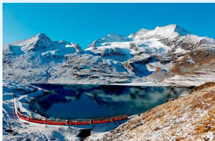
Bernina Express nabízí dechberoucí pohledy na alpská jezera

Glacier Express se v jednom z tunelů otočí o 270 stupňů a současně vystoupá o 150 metrů!