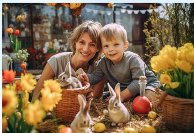
Velikonoce nejsou jen křesťanskou tradicí, ale také oslavou příchodu jara