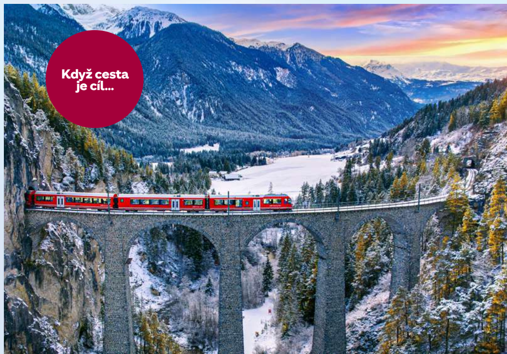
Jízda ledovcovým expresem je nezapomenutelným zážitkem

Glacier Express se v jednom z tunelů otočí o 270 stupňů a současně vystoupá o 150 metrů!