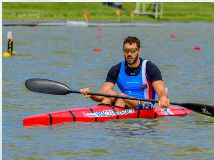
V Paříži vyhrál závod singlajaků na 1 000 metrů

Na tohle já mám takový figl, a to že jdu na ryby. Ještě když jedu autem, pořád myslím na to, co bylo a co bude, ale v momentě, kdy nahodím mušku do vody, moje hlava úplně vypne a dokáže se relaxovat.