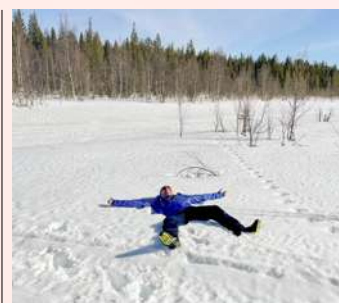
Někdy je potřeba i odpočívat...

Arktický ráj pro běžkaře za polárním kruhem