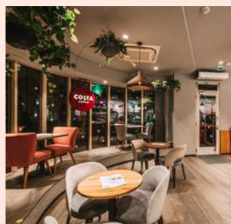
V kavárně Italská máme stoly vyrobené z kartonů od mléka

~~~~~ Přijďte si pro kávu s vlastním hrnečkem! Na redukci odpadů a zelenější planetě nám opravdu záleží.