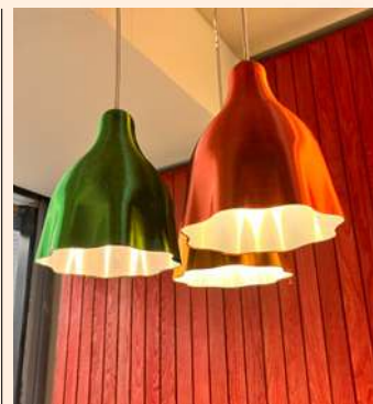
Designové lustry z recyklovaného plastu

využití produktů a materiálu a co nejmenší produkci odpadu.