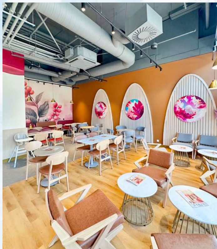
Rekonstruovaná kavárna v Ústí nad Labem okouzlí barevným provedením

výraznými malbami na zdech a spoustou osvěžující zeleně je nepřehlédnutelná. Kavárnu otevřeme i ve zcela novém obchodním centru Grand v Pardubicích. Ta se bude pyšnit označením „udržitelná“ – částečně je totiž vybavena recyklovaným nábytkem, který dostal nový kabát.