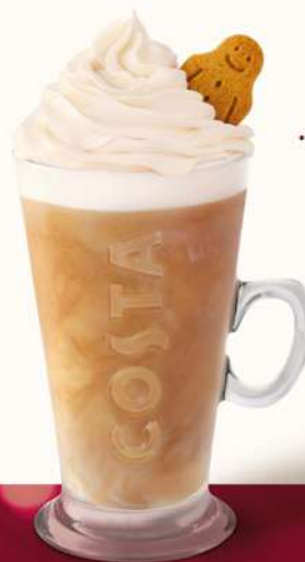
Gingerbread Caffè Latte

this year, there's a new treat - gingerbread whipped cream included in the price! This gives the charming Gingerbread Caffè Latte a further touch of magic. Deliciously milky and flavourful, it's sure to kick-start and sweeten your day, not to mention being a pleasure to look at. After all, the essential ingredient of every one of our gingerbread lattes is Mr Gingerbread, a little symbol of Christmas here at Costa Coffee.