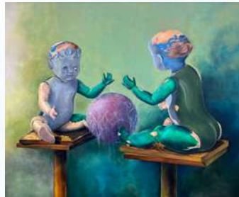
Pravda a lež

Její díla spojuje jednoduché motto: „Hlavně se nebrat moc vážně.“ V obrazech se proto střídá realismus s abstrakcí, geometrie s expresí, barvy s klidem i nadsázkou. Každý kus vypráví příběh – někdy inspirovaný „obyčejnými“ okamžiky všedního dne, jindy atmosférou Istrie, kde autorka několik měsíců tvořila a dokonce využila tamní červenou zeminu jako součást obrazu. Zajímavá jsou i díla, kde malbu propojuje s tiffany technikou – tedy s prvky vitráže či háčkovaného měděného