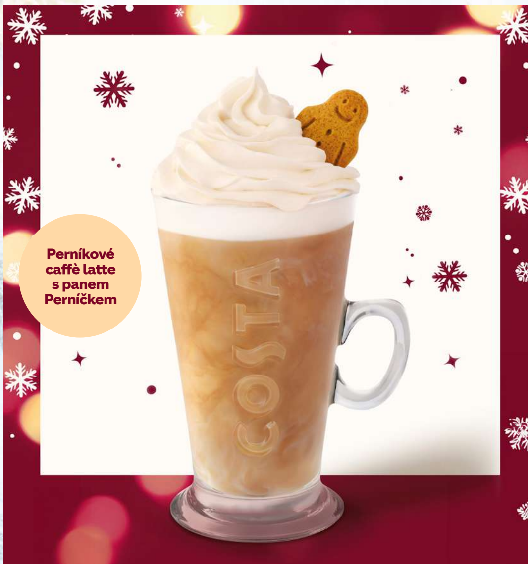
Perníkové caffè latte s panem Perníčkem