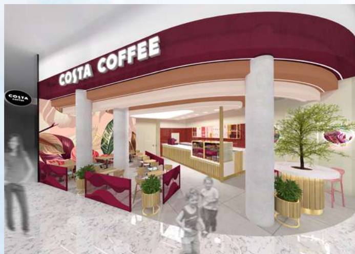
Vizualizace kavárny v pražském centru Westfield Černý Most